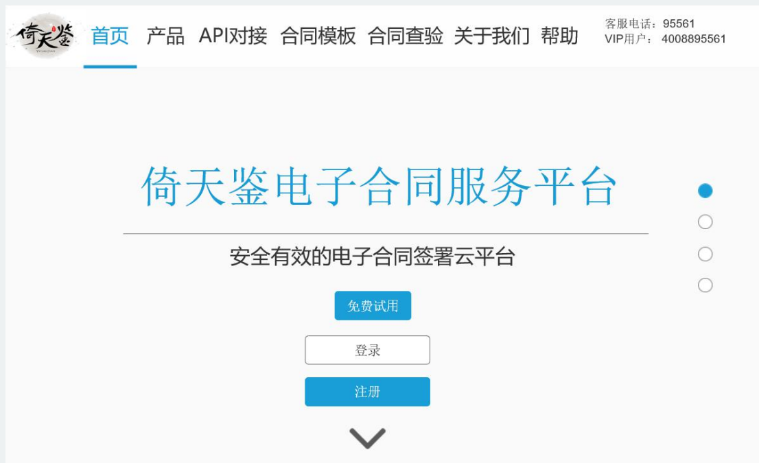
电子合同签署平台

基于区块链技术储备搭建的平台原型，可以完成合同签署、在线存储、痕迹存储等等多种功能。数金区块链技术建立在IBM Hyperledger基础之上，开源可信，技术优越。由于自建联盟链，可对存证要素做定制化开发，个性化配置空间大。